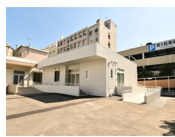
「長崎大学(坂本2)トリアージ施設新営工事」 (長崎大学) 令和3年10月竣工