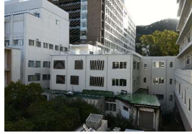
「長崎大学(坂本2)総合研究棟(医歯薬学系)改修その他工事」 (長崎大学) 令和5年3月竣工