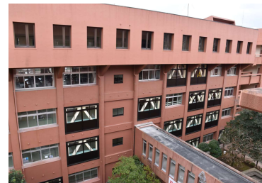
「瓊浦高等学校3年生棟他耐震補強工事及び改修工事」 (学校法人 瓊浦学園) 平成27年12月竣工