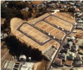
「花高台団地造成工事」 (佐世保市) 昭和62年竣工