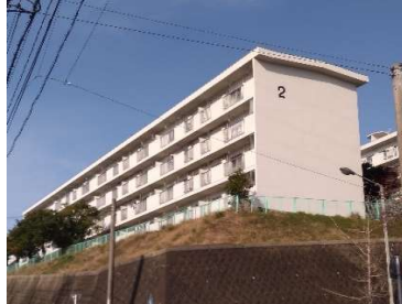
「西山第2AP外部改修工事」 (長崎県) 令和5年3月竣工