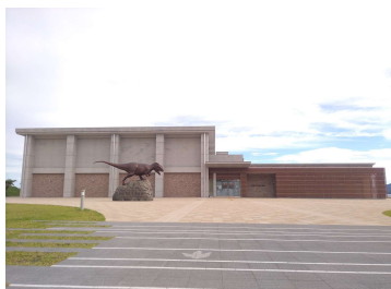
「(仮称)長崎恐竜博物館建設主体工事」 (長崎市) 令和3年3月竣工