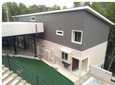
「かたふち村 共同住宅新築工事」 (社福)日輪会 令和5年6月竣工