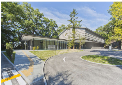
「長崎県立長崎図書館郷土資料センター(仮称)新築工事」 (長崎県) 令和3年10月竣工