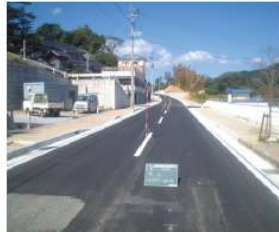
「矢上町山手線(3工区)道路改良工事(3)」 平成16年10月竣工