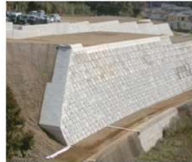
「平間・東地区12街区ほか整地工事」 (長崎市) 平成21年2月竣工