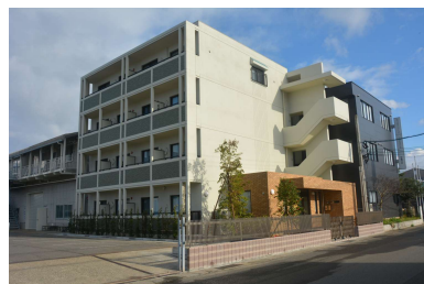
「扶桑工業(株)長崎神ノ島寮新築工事」 (扶桑工業㈱) 平成30年3月竣工