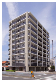
「(仮称)ネオ・プレイス大村西本町新築工事」 (長崎大建不動産㈱) 令和2年6月竣工