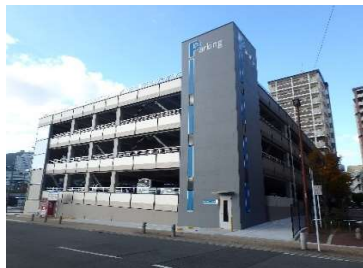
「(仮称)元船町駐車場 新築工事」 (長崎魚市㈱) 令和5年11月竣工