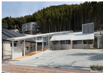
「愛宕保育園新築工事」 (社福)正道会 平成28年5月竣工