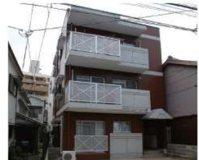
「夫婦川川IMYコーポ改修工事」 (長崎市) 平成25年12月竣工