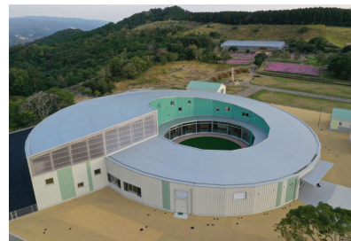
「全天候型子ども遊戯施設新築主体工事」 (長崎市) 令和4年7月竣工