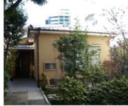
「S邸新築工事」 (長崎市) 平成19年12月竣工