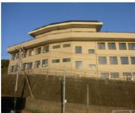
「O邸改装工事」 (長崎市) 平成19年12月竣工