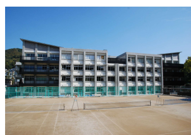
「長崎北高校特別教育棟改築工事(2工区)」 (長崎県) 平成26年3月竣工