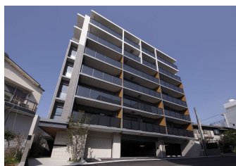
「(仮称)ネオ・プレイス平和町新築工事」 (長崎大建不動産㈱) 平成31年1月竣工