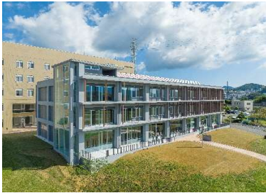
「長崎県立大学スクールホム校 情報科学リサーチ産業 共同研究センター(仮称)新築工事」 (長崎県立大学) 令和4年10月竣工