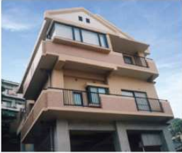
「Y邸新築工事」 (長崎市) 平成17年8月竣工