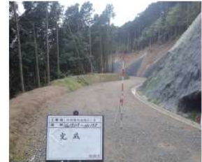
「林道権現線開設工事」 (長崎市) 平成26年3月竣工