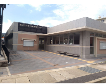
「滑石地域センター新築主体工事」 (長崎市) 令和3年8月竣工