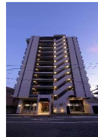
「(仮称)ネオ・プレイス城栄町新築工事」 (株)長崎大建不動産 令和5年6月竣工