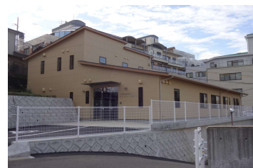
「(仮称)小規模多機能型居宅介護ケアライト愛宕Ⅲ新築工事」 (医療法人 博和会) 平成30年12月竣工