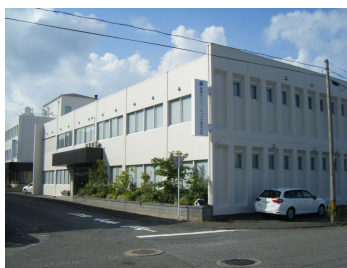
「扇精光田中町社屋外壁改修工事(第1期:リノベーション棟)」 (扇精光ホールディングス㈱) 令和4年6月竣工