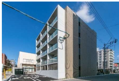
「(仮称)リアルガード新大工町駅新築工事」 (リアンホールディングス㈱) 令和6年1月竣工