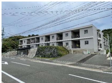
「(仮称)野母崎団地公営住宅新築主体工事」 (長崎市) 令和4年10月竣工