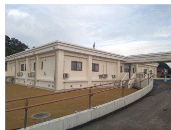
「(社福)五福会 グループホーム琴の浦荘増築工事」 (社福)五福会 令和3年11月竣工