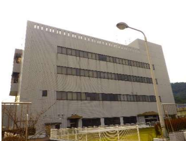
「旧クリーンセンター内部改修主体工事」 (長崎市) 令和6年2月竣工